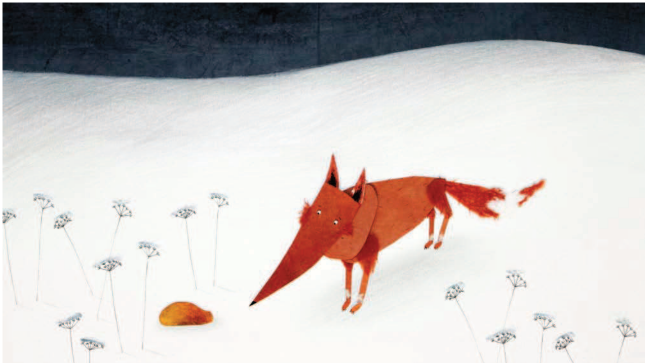
Plan final assemblé: animation papier + animation trait + décor