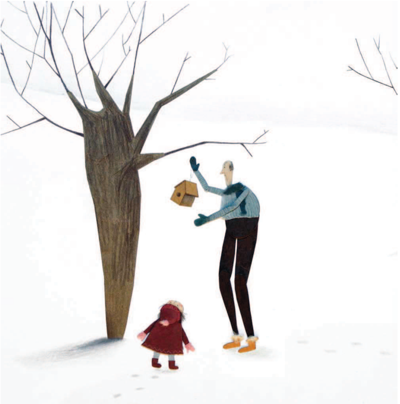
Plan ayant été animé directement sur le décor. Ajout du trait numériquement (corde nicher, cheveux, etc.)